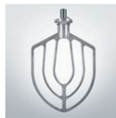
Spatule / Spatula