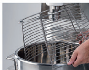
BT40-60-80 Protection cuve démontable Detachable bowl safety