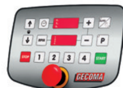
Tableau de commande à variation manuelle et 1 Minuter Control panel with manual adjustment and 1 Timer