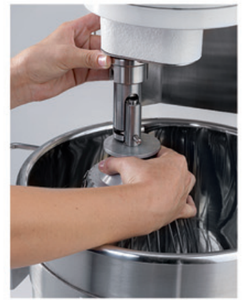
BT12B-20B Accrochage outil Tool hooking system