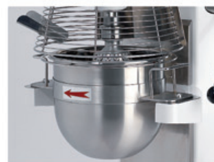
BT40-60-80 Réduction cuve Bowl reduction system