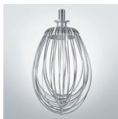
Fouet fils minces Fine wire whisk