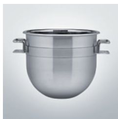
Cuve / Bowl