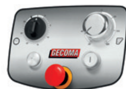
Tableau de commande à 3 vitesses et 1 Minuter / Control panel with 3 speeds and 1 Timer