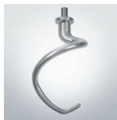
Crochet / Hook