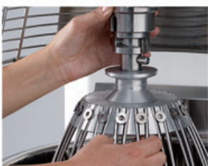
BT40-60-80 Accrochage outil Tool hooking system