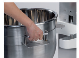
BT40-60-80 Blocage automatique cuve Bowl automatic locking