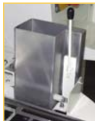
«Boîte à sel»